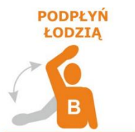
WYMACHIWANIE PRAWĄ LUB LEWA RĘKĄ

W przypadku zauważenia łodzi lub na zapytanie sędziego zawodnik sygnalizuje, że nie ma żadnych problemów.