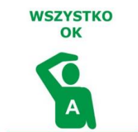
PRAWA LUB LEWA RĘKA POŁOŻONA NA GŁOWIE

W przypadku zauważenia łodzi lub na zapytanie sędziego zawodnik sygnalizuje, że nie ma żadnych problemów.