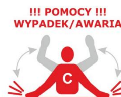
UDERZANIE JEDNĄ LUB OBIEMA RĘKOMA O TAFLE WODY

Zawodnik po nawiązaniu kontaktu wzrokowego z łodzią prosi o jej podpłynięcie.